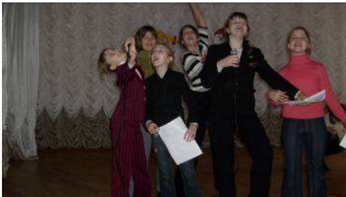
Участники конкурса – девочки 5А класса